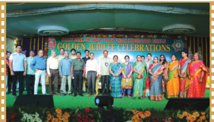
ఆత్మీయులతో కా||శర్మ దంపతులు