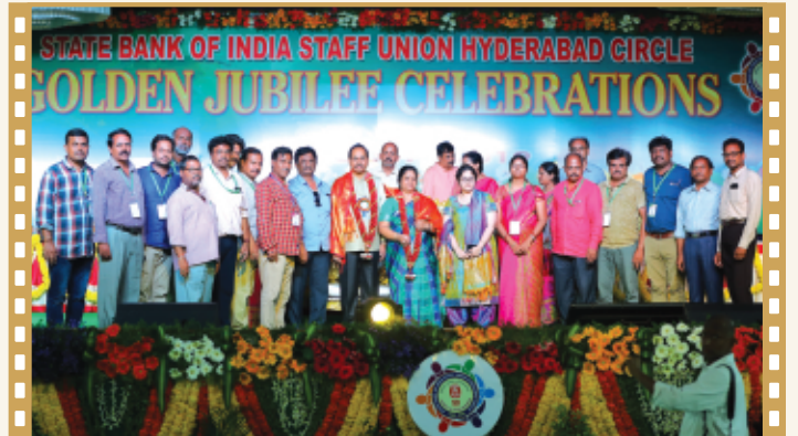
కా||శర్మ దంపతులను సన్మానిస్తున్న తిరుపతి కార్యవర్గ సభ్యులు