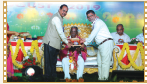
కా||వి.సదానందేశ్వరయ్య గారికి సన్మానం