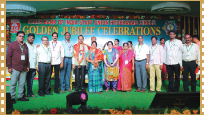
కా||శర్మ దంపతులను సన్మానిస్తున్న విజయవాడ కార్యవర్గ సభ్యులు