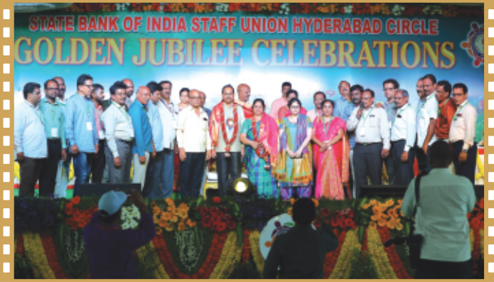
కా||శర్మ దంపతులను సన్మానిస్తున్న హైదరాబాద్, సికింద్రాబాద్ కార్యవర్గ సభ్యులు