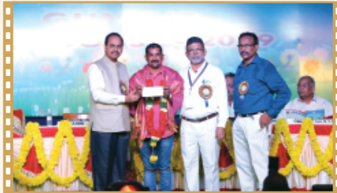
అమ్మనాన్న అనాధ ఆశ్రమానికి విరాళం