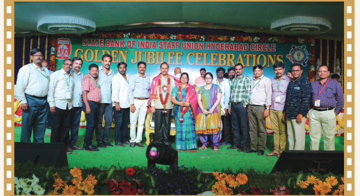
కా||శర్మ దంపతులను సన్మానిస్తున్న విశాఖపట్నం కార్యవర్గ సభ్యులు