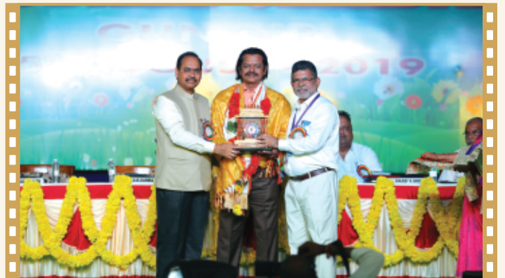
కా||ఎన్.రాధాకృష్ణన్ గారికి సన్మానం