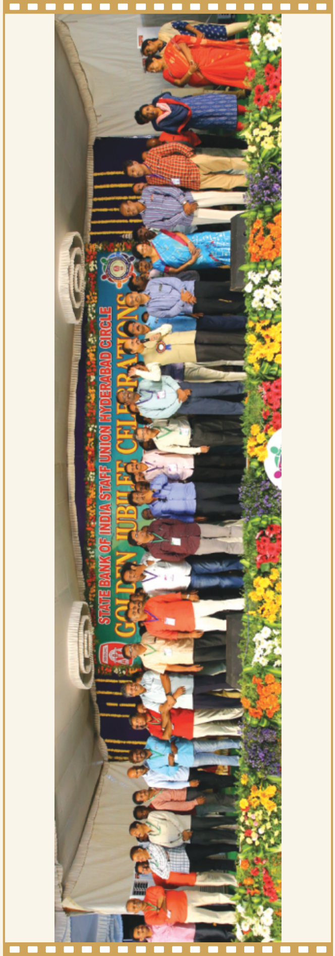
అమరావతి సర్కిల్ నూతన కార్యవర్గ సభ్యులు