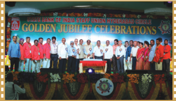
స్వర్ణోత్సవాల సందర్భంగా కేకు కటింగ్