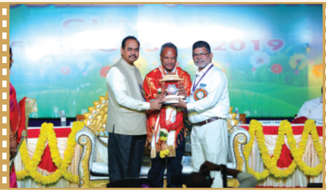
కా||బి.దీనదయాళ్ గారికి సన్మానం