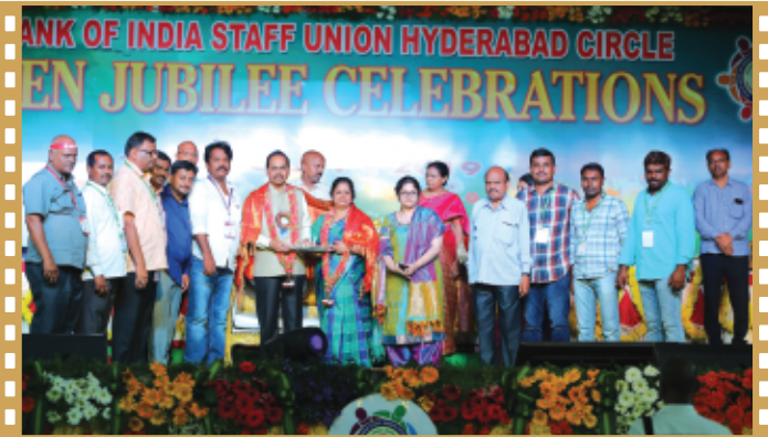
కా||శర్మ దంపతులను సన్మానిస్తున్న కర్నూలు కార్యవర్గ సభ్యులు