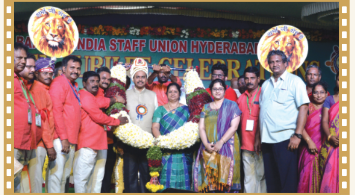
కా||శర్మ దంపతులను సన్మానిస్తున్న గుంటూరు కార్యవర్గ సభ్యులు